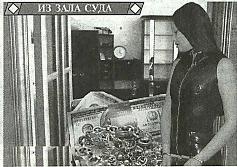
ИЗ ЗАЛА СУДА