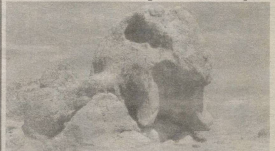
Навоий вилоятининг Хатирчи тумани Сангичумон қишлоғидаги қадимий тошлар.