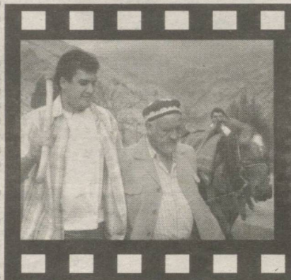
қарши олади, қизиқиб кўради. Шу маънода Ўзбекистон хотин-қизлар кўмитаси, "Ўзбеккино" мил-

жатли фильмларга бевосита боғлиқдир. Энг муҳими, халқона, яхши кино асар бўлса, у ёшми, каттами, барибир томошабин сифатида хуш