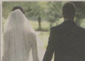
ЭРТА ТУРМУШ — КЕЛТИРАР ТАШВИШ