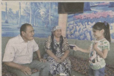
САХОВАТЛИ ЗАМИН ФАРЗАНДИМАН!