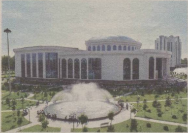
У КУНЛАР ЭНДИ ЭРТАК