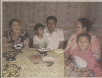
ОСТОНАСИ ГУЛЛАЁТГАН ОИЛА