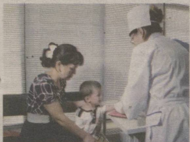
ЯНА БИР ҚУЛАЙЛИК