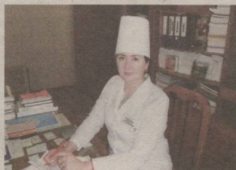
САРАТОНДАН АВВАЛ ҚЎРҚУВНИ ДАВОЛАШ КЕРАК!