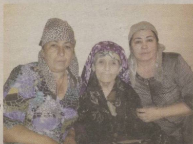
ЮЗГА ЕТАЁТГАН МОМО