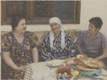
95 ЁШЛИ УСТОЗ