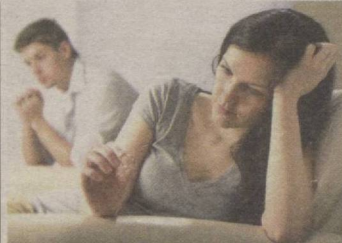
ГУМОН ИЙМОНДАН АЙИРСА...