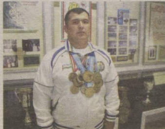
ЧЕМПИОННИНГ ЧЕМПИОН ЁҒЛИ