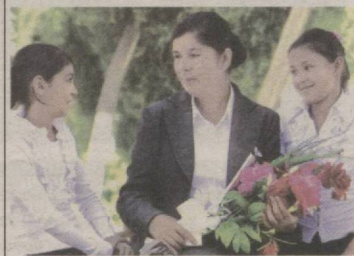
ПУЛ ЎРНИГА, ГУЛ ТУТҚАЗИНГ!