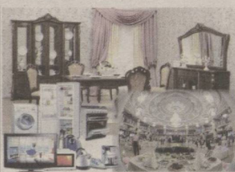
АЁЛНИНГ МОЛИ МИННАТЛИ(МИ?)