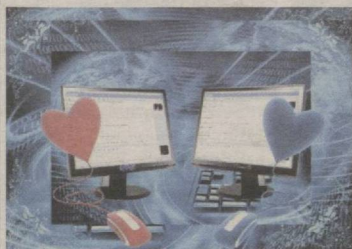
ЯНГИ МУАММО: ВИРТУАЛ ХИЁНАТ