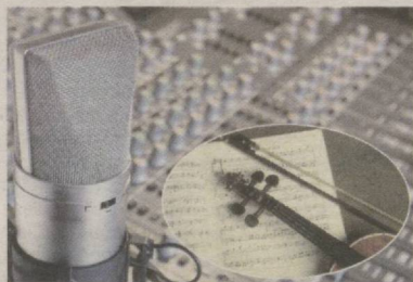
САНЪАТ ҲАВАС МАЙДОНИ ЭМАС