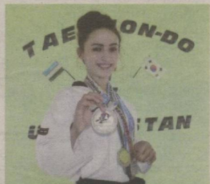
САБР, МАТОНАТ ВА МУҲАББАТ 2 ▶