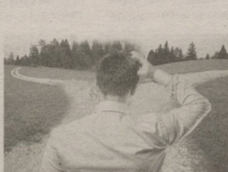
МЕН СИЗГА АЙТАМАН 6▶