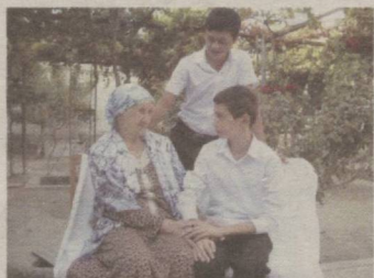
АХИЛЛИК — ҲАЁТ ҲИКМАТИ 2▶