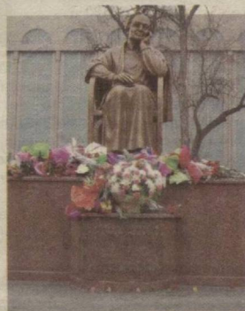
Ойдин ҲОЖИЕВА, Ўзбекистон халқ шоири

1 Март — Ўзбекистон халқ шоири Зулфия таваллуд тошган кун