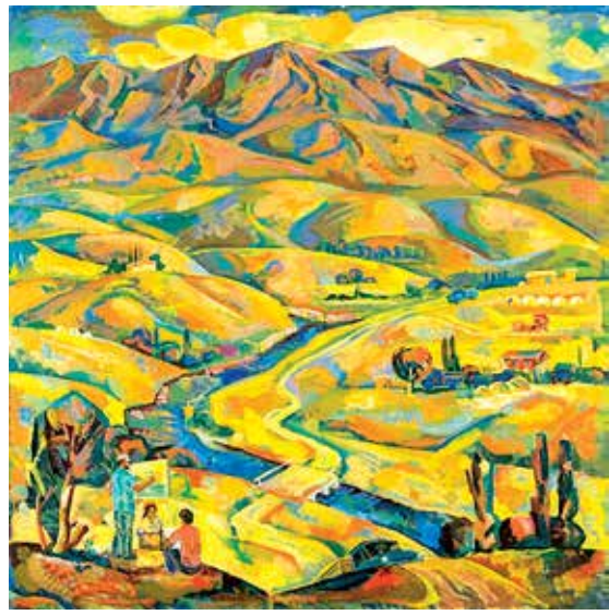
Тогда кўз (1978)