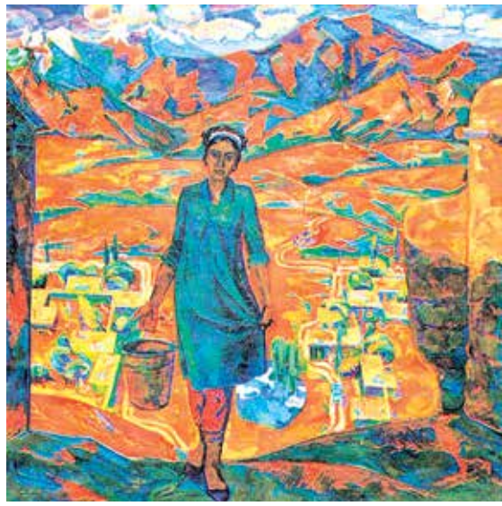
Бахмалда кўз (1978)