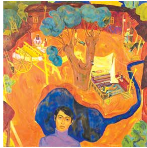
Менинг болалигим (1971)