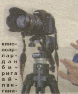
киноасарлардан бирига айланганининг

— «Алданган аёл» қайта-қайта томоша қилинадиган