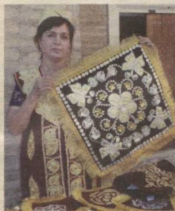
2 ХУНАРМАНД АЁЛЛАР ФОРУМИ

Газета 1991 йил 1 сентябрдан чиқа бошлаган