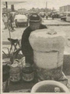
3 ШИРИН ШАРБАТНИНГ АЧЧИК АЛАМЛАРИ