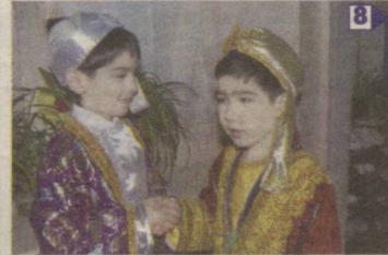
ТАРБИЯ САЛОМДАН БОШЛАНАДИ