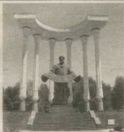
ФАРФОНАГА БИР КЕЛИНГ