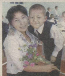
ИНСОНИЯТНИНГ ИЛК МУРАББИЙЛАРИ