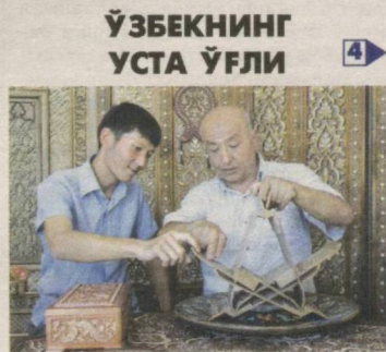
ЎЗБЕКНИНГ УСТА ЎғЛИ