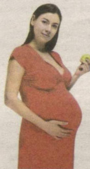
ТЎҚҚИЗ ОЙЛИК СИНОВ