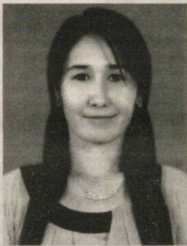
«Камолот» ЁИХ стипендианти бўлди.

Дастлаб ноанъанавий усулдаги янги лойиҳа — «Мактабга таълим муассасаларида инглиз тилини ўрганиш йўлга қўйиш ва тоқомиллаштириш» мавзуси бўйича «Happy Kindergarten» мультимедиа дастурини ишлаб чикди. Лойиҳа муваффақиятли дея эътироф этилгани боис ўтган йўлда Қизлархон «Камолот» ЁИХ стипендианти бўлди.