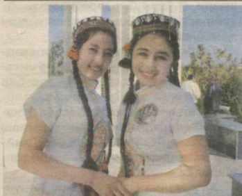
ОРАСТА ҚИЗЛАР БЕЛЛАШИШДИ