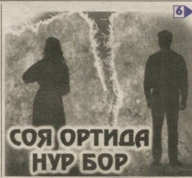
СОЯ, ОРТИДА НУР БОР