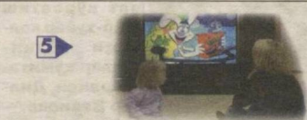
ВИРТУАЛ ОЛАМДАН РЕАЛ ХАВФ-ХАТАР