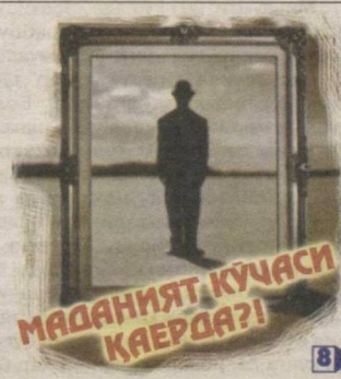
МАДАНИЯТ, КУЧАСИ КАЕРДА?!