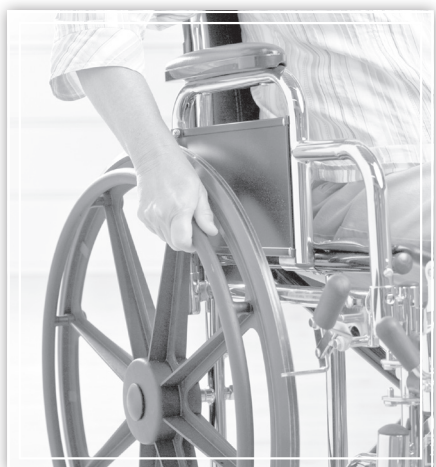
Шу билан бирга, 52 нафар ёлғиз фуқароларнинг турар-жойига кадастр ҳужжатлари расмийлаштирилиб, 67 нафарининг уй-жойини таъмирлаш бўйича чора-тадбирлар ишлаб чиқил-

чуқурлаштирилган тиббий кўрикдан ўтказилиб, 602 нафарига врач рецепти асосида дори-дармон ва боғлов материаллари етказиб берилди. Шунингдек, 59 кишининг стационар, амбулатор ва уй шароитида даволаниши учун имконият яратилди. Бундан ташқари, 288 та ҳасса, 191 та ногиронлик аравачаси, 99 та эшитиш мосламаси, 58 та қўлтиқтаёқ, 22 та ходуюк - юриш мосламаси ва 11 нафарига кийим-кечаклар ва бошқа ҳаракат воситалари олиб берилди.