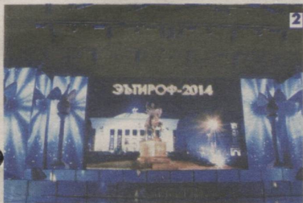
ЭЪТИБОР ВА ЭЪТИРОФ