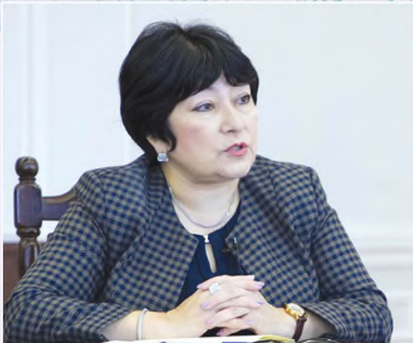
Камола ОҚИЛОВА, Ўзбекистон Республикаси маданият вазири ўринбосари, санъатшунослик доктори