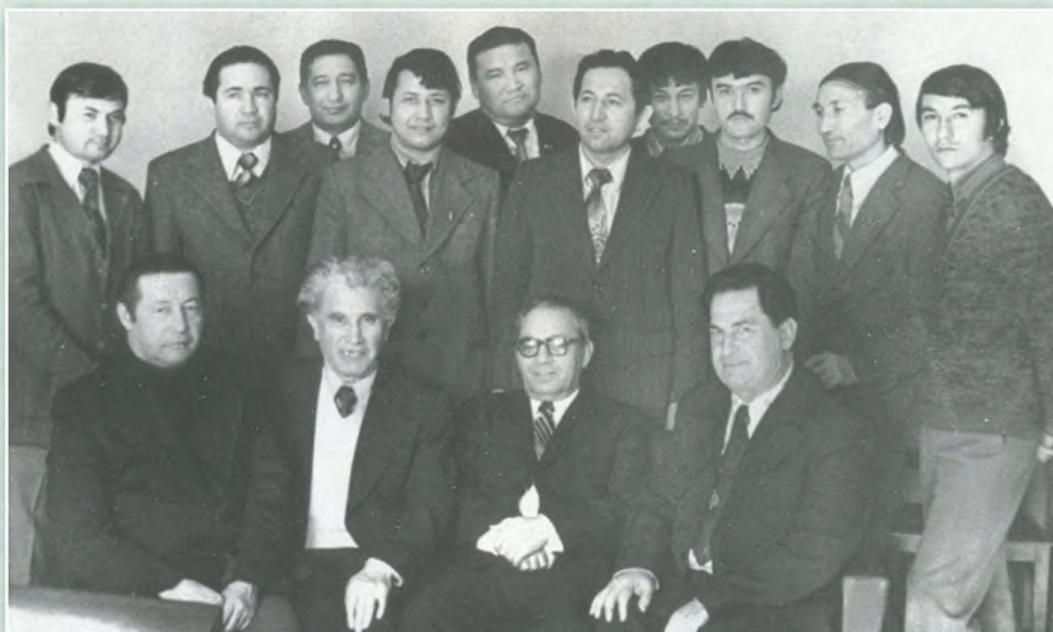
«Гулистон» журнали жамоаси. Устозлар ва шогирдлар. 1979 йил.

учрашолмаган. У киши гоҳ меҳнат таътилида бўлган, гоҳ Москвада пленумда.