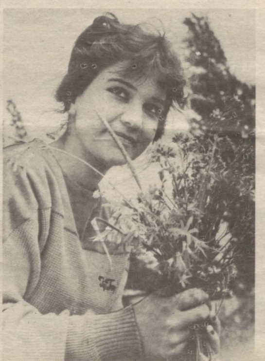
Гул ва гуличехра...