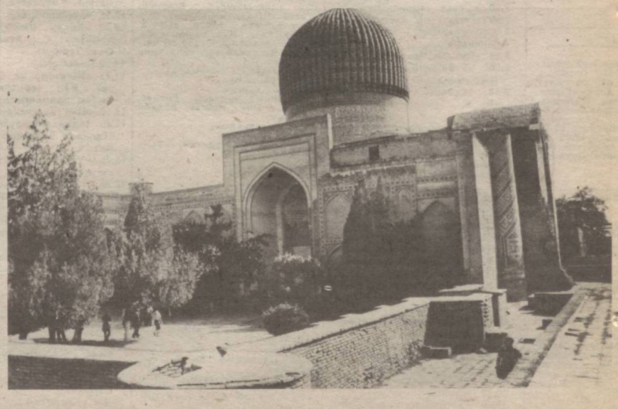
Мозийдан жерос шўнғиза.

қариб турибди: Жон Бровер Миннок (1941 йил, АҚШ) — 635 кг., Уолтер Хадсон (1944 йил, АҚШ) — 545 кг., Майк Уокер (1934 йил, АҚШ) — 538 кг., Роберт Эрл Хьюз (1926 йил, АҚШ) — 485 кг. Америкалик Эдвард Харнер эса 170 сантиметр бўйи билан атиги 22 килограмм тош босган. Уни «Питон суяги» деб аташган. 1825 йили Клод-Амбрауза Сера (Франция)нинг елка мускуллари ўлчанганда айланасига 10 сантиметрни ташкил қилган. Унинг оғирлиги 35 килограмм деб қайд этилган.