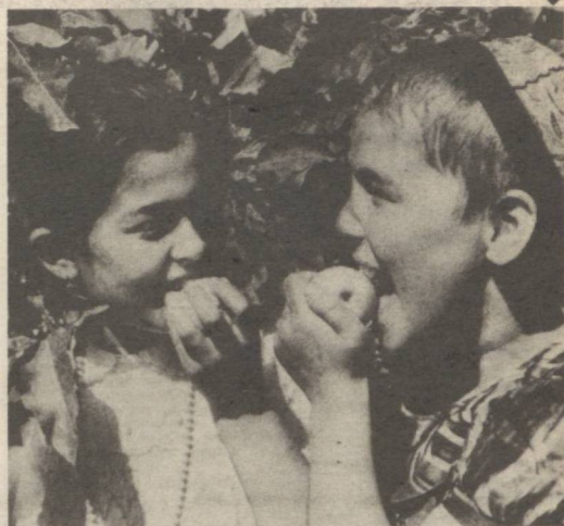
Бунча ширин бўлмаса... Суратқаш Р. Альбеков

бўйича қабул қилинган қарорда илмий текшириш маркази тайёрланган иш юритиш қорозлари, ҳужжатлари ва йўриқномаларни чоп этиш учун маблағ ажратиш, август ойининг биринчи ўн кунлигида Қашқадарё вилояти алоқа корхоналарида давлат тилига қандай амал қилинаётгани юзасидан текшириш ўтказиш кўзда тутилган.