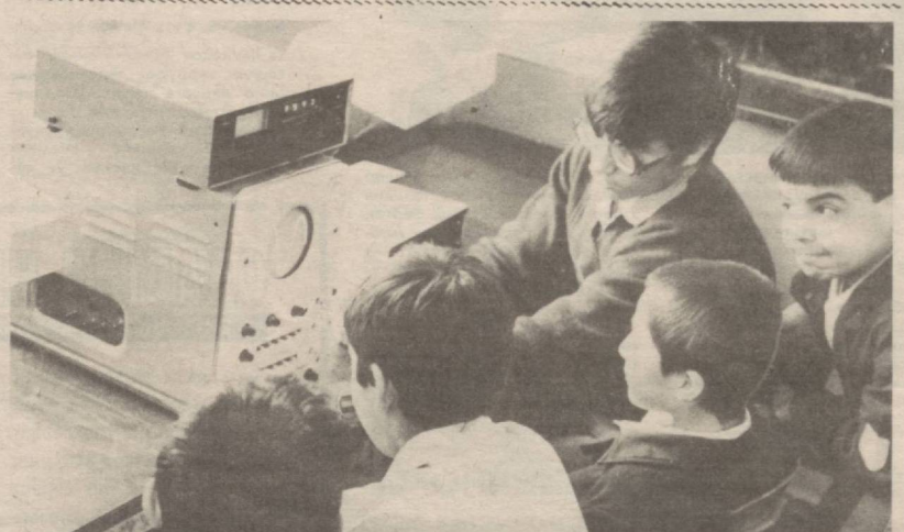
Техника билан мулоқот.

Радио нуқталаридан фойдаланиш ҳам қониқарли эмас. Мижозлар рамизий равишда ойнага 30 сўмдан ҳақ тўлашлари лозим. Аммо уни ҳам ўз вақтида тўлашмайди. Алоқа корхоналарининг раҳбарлари ва мутахассислари юзага келган вазиятдан чиқиб йўлларини излашмоқда.