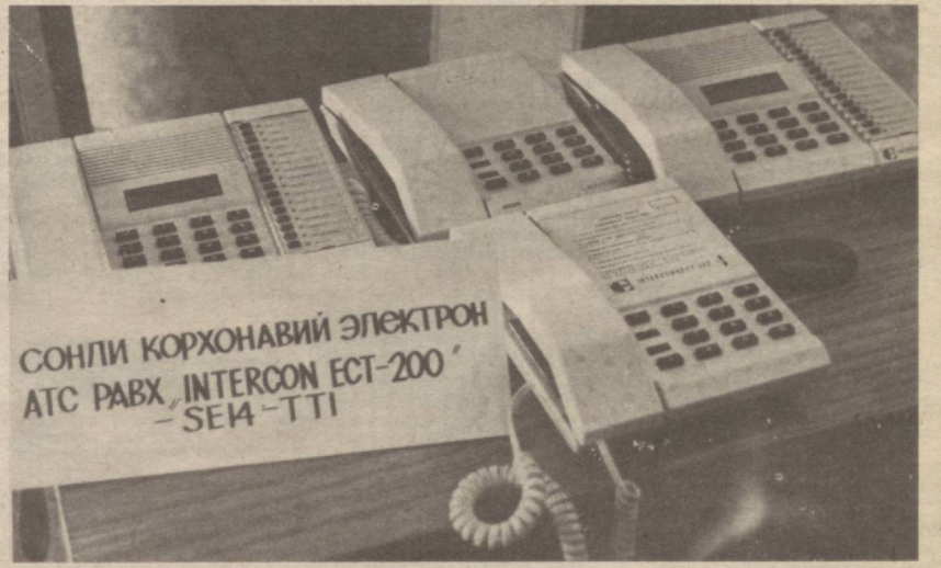
Замонавий алоқа воситалари.