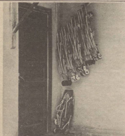
Сиз қандай изоҳлайсиз?

— Тиш, дўхтири машҳур артист Жан Габеннинг ти- шини сугуриб олибди. Орадан бир неча кун ўтгач, артист дўхтирдан шундай хат олибди: “Олинган ти- шингизни бир муҳлисингизга сотдим, у тумор қилиб тақиб юрибди. Хизмат ҳақини ўша пулдан ушлаб қолдим, қайтимини юбораёрман”.