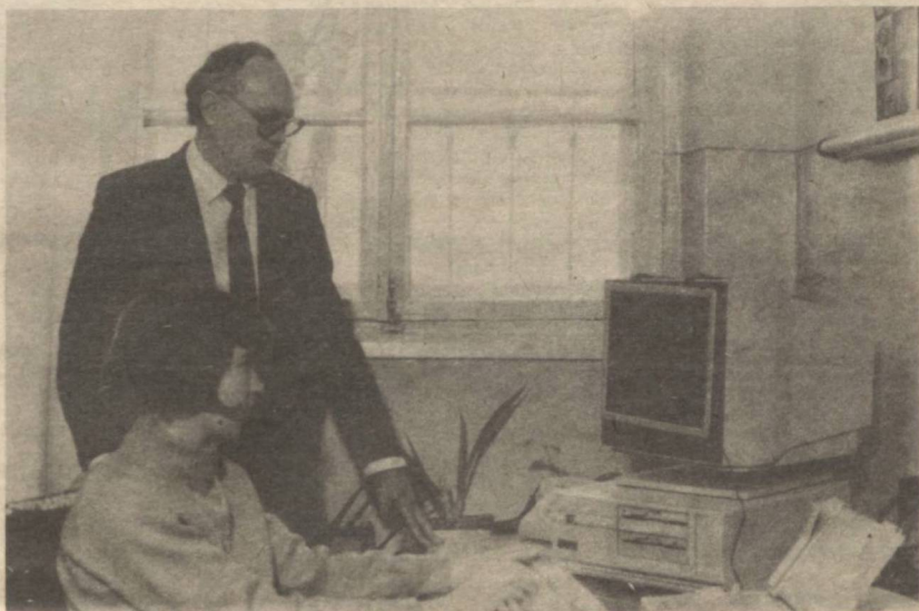
Тошкент алоқа коллежыда талабалар замонавий ўқув қуроллари асосида билим олишмоқда.