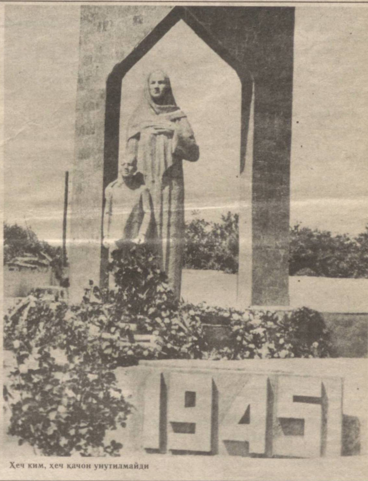
Ҳеч ким, ҳеч қачон унутилмайди