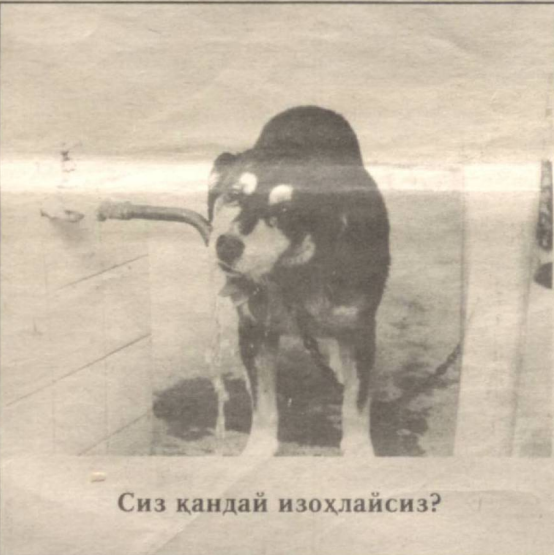
Сиз қандай изоҳлайсиз?

Аёл ўз дуғонасига "Фақат ҳеч кимга айтма" деб сирини ошкор этди — демек у шу гап тезроқ тарқалишини истайди.