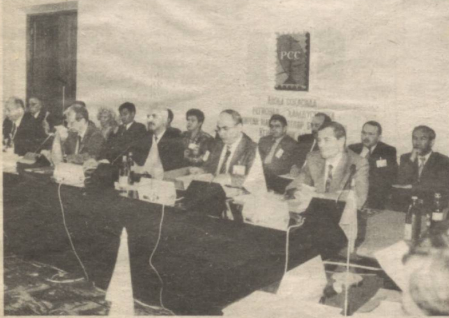
Суратда: Анжуман иштирокчилари.

Алоқа вазирлигида бу борада амалга оширилган ишларнинг яқунлари кўриб чиқилди.