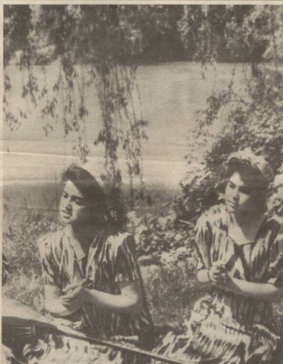
«Халал берманг агар қизлар ҳаёл сурсалар».