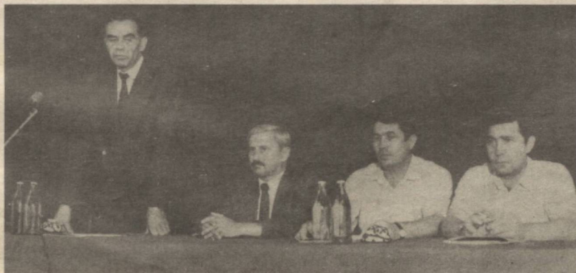
СУРАТДА: Кенгаш иштирокчилари.

Кенгашнинг техник ишчи гуруҳида 12 мамлакатдан вакиллар иштирок этди. Унда Транс — Осие — Европа магистрал кабелъ лойиҳаси қатнашчиларининг ишчи гуруҳи қурилиш тўғрисидаги техник ҳисоботлари тингланди. Эрон Ислоом давлатининг