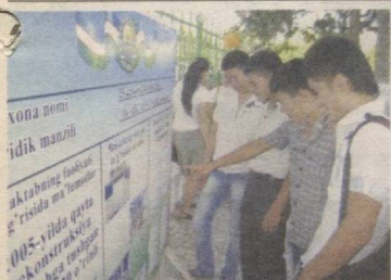
Иқтидорли ёшларга кенг йўл 2▶

Газета 1991 йил 1 сентябрдан чиқа бошлаган