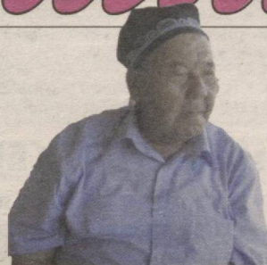
Эл олқишин олган отахон 5▶