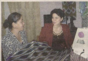
Аёл тадбиркор бўлса... 4▶