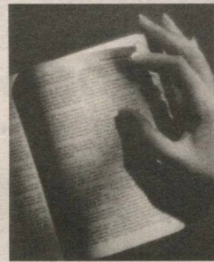
Сўнги васият 6▶