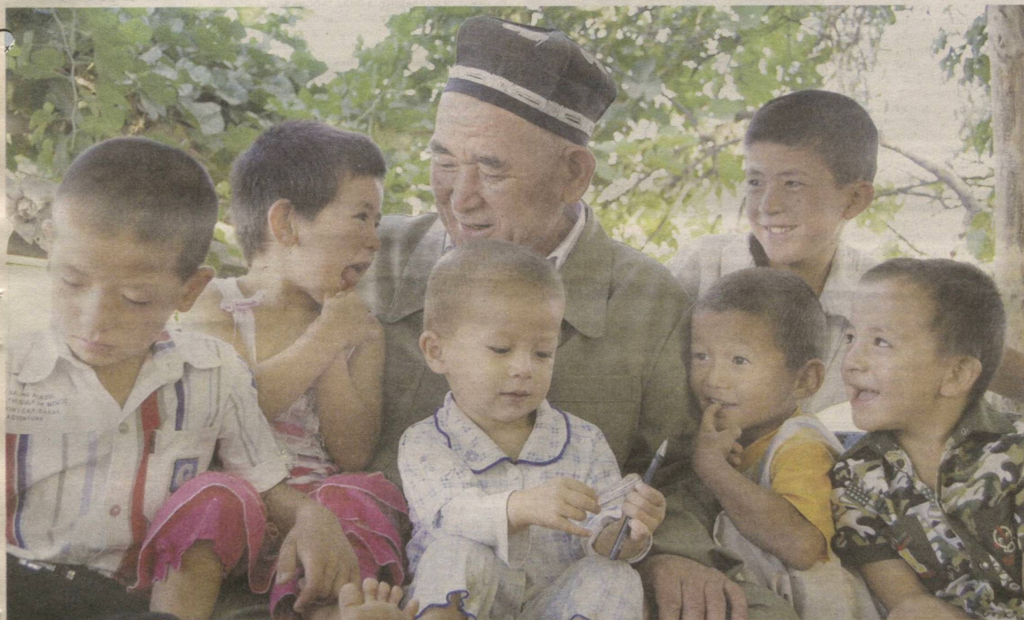
Болали уй бозор дейдилар...