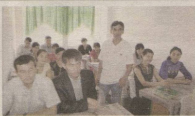
4 Ўқув марказлари: Эътироф ва эътироз