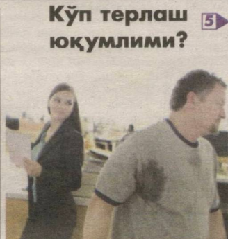
5 Кўп терлаш юқумлими?