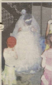
2 Қариндошга қиз берган эдик...