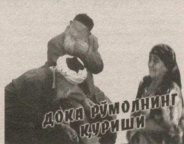
6 ДОКА РЎМОЛНИНГ ҚУРИШИ