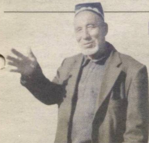
Яхшидан ном қолади...