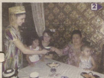
Истиқлол берган саодат