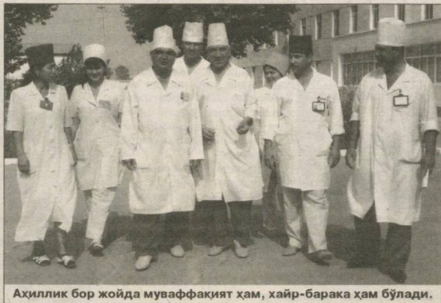
Аҳиллик бор жойда муваффақият ҳам, хайр-барака ҳам бўлади.

содиқ қолди. Дастлаб замонавий тиббиёт янгиликларини вилоят ҳудудида омалаштиришга интилди. Сихатгоҳдаги барча бўлимлар таъмирланиб, янги та-