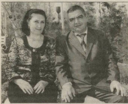
Бир олмағнинг икки юзи...