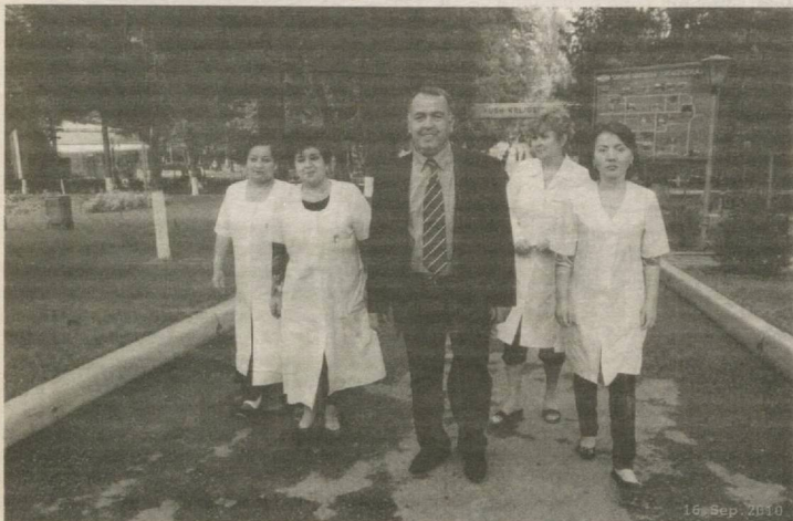
16. Sep. 2010