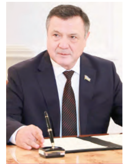
Нурдинжон ИСМОИЛОВ, Олий Мажлис Қонунчилик палатаси Спикери:

Олий Мажлис Қонунчилик палатаси депутатлари Мурожаатномада илгари сурилган ғоялар, белгилаб берилган вазифаларга фаол муносабат билдиришмоқда.