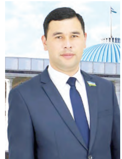
Шерзод РАҲМОНОВ, Олий Мажлис Қонунчилик палатаси депутати, ЎзХДП фракцияси аъзоси:

Мурожаатномада юрт ободлиги, халқ фаровонлиги йўлида белгиланган улуғвор вазифаларни амалга ошириш мақсади барчани янада бирлаштиради ва келажакка ишончни мустақкамлайди. Парламент Президент томонидан билдирилган ишончдан фахрланади ва бу ишонч масъулиятини чуқур англайди. Белгилаб берилган вазифалар сифатли бажарилишини таъминлаш учун қатъият ва масъулият билан ҳаракат қилади.