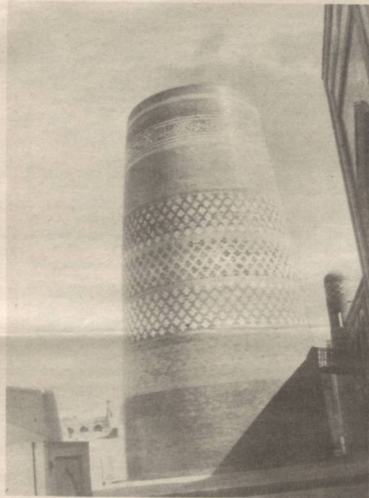
Хива. Калта минор. Сураткаш Т. ЛУТФУЛЛАЕВ