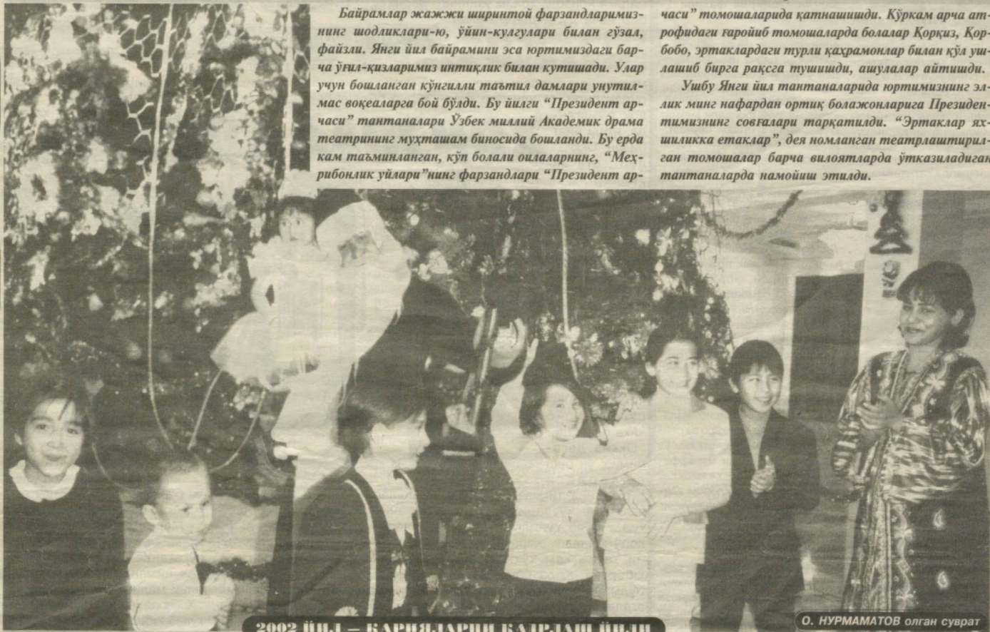
2002 йил — қарияларни қадрлаш йили