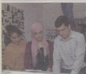
2 Қўлигул чевар... йигит