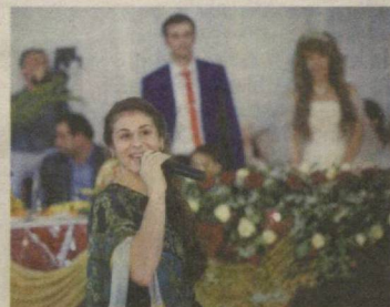
ТЎЙГА БОРСАНГ... 8 ▶