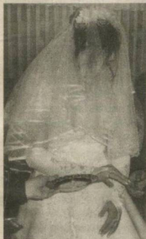
ХОЮ ХАВАС НАДОМАТ КЕЛТИРМАСИН