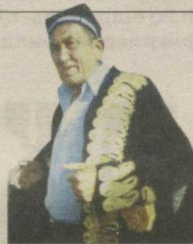
ДАВРА 6 ТЎРИДАГИ УСТОЗ