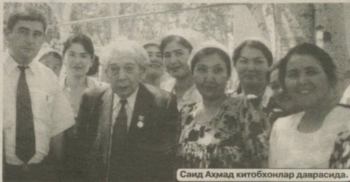
Саид Аҳмад китобхонлар даврасида.

- Инсон агар замондошлари томонидан тан олинса, жамоатдошлари ўртасида ўзининг ўрни бўлса, ўз овози бўлса, унга ўшайдиганини топиш қийин бўлиб қолса, шахс даражасига етган бўлади. Шахс даражасига эришиш бир муҳр билан, мукофот тарзида, имтиёз тарзида берилмайди. Саидахон опа шахс даражасига кўтарилган улкан адиба, шоира эдилар.