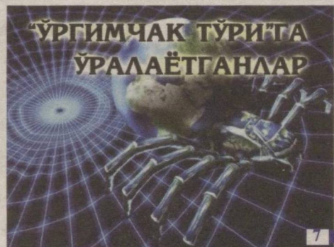
“ЎРГИМЧАК ТҮРИГА ЎРАЛАЁТГАНЛАР”