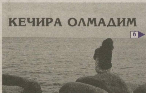
6 КЕЧИРА ОЛМАДИМ