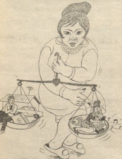
Қизи борнинг пози бор, Қўлида тарози бор...

Иккита эркак қиморхонадан келяпти. Бири қип-яланғоч, унисининг иштони қолган, холос. Яланғочи ше-