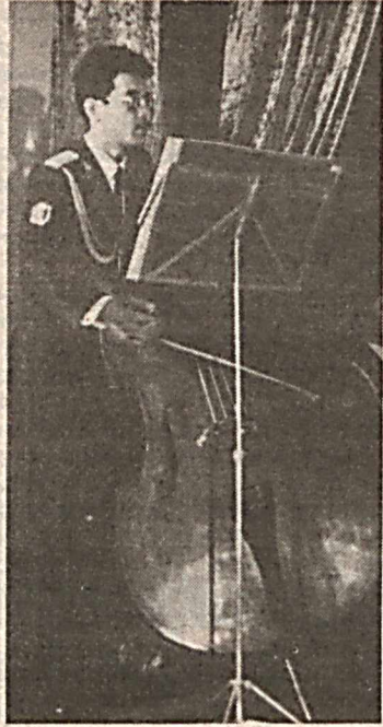
В ЯНВАРЕ 1993 года был создан Образцово-показательный оркестр

Отшумели веселые ливни, Отцвела молодая сирень, И по-летнему пылким и длинным Стал июньский безоблачный день. Не звучат соловьиные трели Над волнистою тенью стогов, И разливы речные мелеют, Входят в русло крутых берегов, Поредели скворчиные стаи Выгорает лазурная высь И в закатном пожаре не тает Облаков лучезарный ковыль. Наливаются силой хмельною Гроздь ягоды на старой лозе Да короной висит золотую Жаркий диск на каленом гвозде.