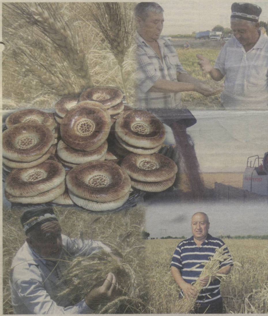
Муҳаммад ЮСУФ, Ўзбекистон халқ шоири

Мен таъзим қиламан бугдой пойига, Ҳали ҳеч кимса-ку бошим эзмаган. Одамлар бор, ахир, туққан жойига, Бир бошоқ бугдойча нафи тегмаган. Чўқсин қошингизга тоғлар, қоялар, Сиз бунга лойиқсиз бугдойпоялар.